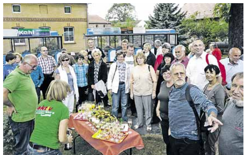
Stärkung bei der zweiten Informations-Sommertour in Tätzschwitz

Zur zweiten Informations-Sommertour hat das Team von aktiv-tours die Seeschlange in Fahrt gebracht. Durch Großkoschen und vorbei am schiffbaren Überleiter zwischen dem Senftenberger und dem Geierswalder See führte der Weg nach Tätzschwitz. In der Schul- und Heimatstube wurde über Geschichte, Traditionen und Schulalltag, sorbische Hochzeiten und Kindstaufen ebenso wie über das Handwerk geplaudert.